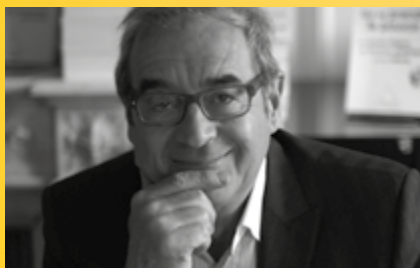
Pascal PICQ