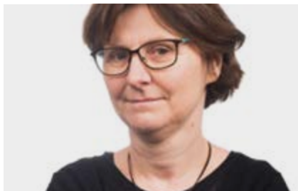
Agnès BENASSY-QUÉRÉ