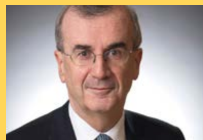
François VILLEROY DE GALHAU