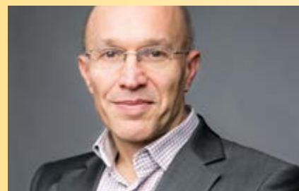
Christian CHAVAGNEUX