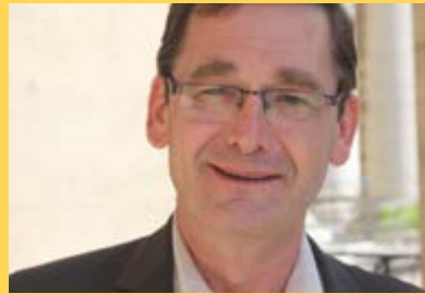
Christian de PERTHUIS © DR