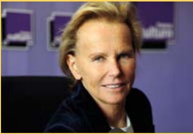
Christine OCKRENT