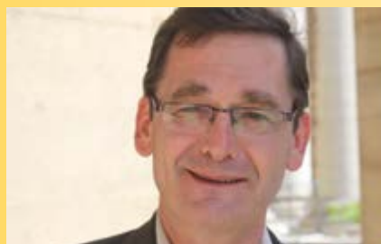
Christian de PERTHUIS