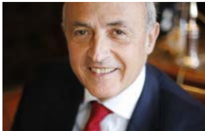
Jean-Hervé LORENZI