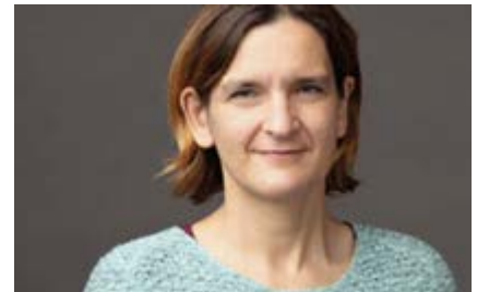
Esther DUFLO