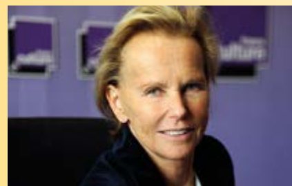
Christine OCKRENT