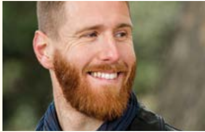
Gilles MITTEAU © DR