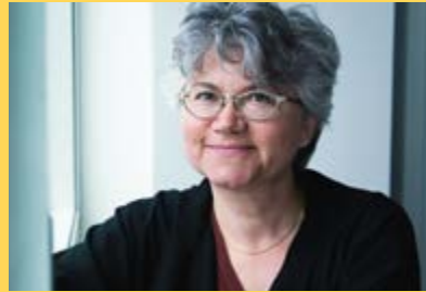
Dominique MÉDA