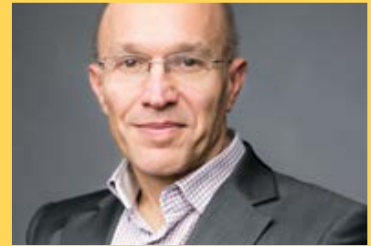
Christian CHAVAGNEUX