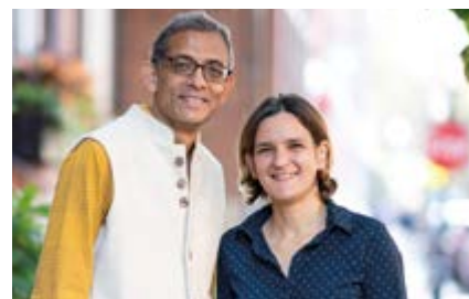
Esther DUFLO et Abhijit V. BANERJEE