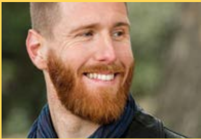
Gilles MITTEAU © DR