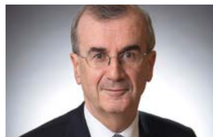
François VILLEROY DE GALHAU