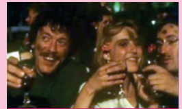
Faictz ce que voudras

Suivi d'une dégustation de vins de Chinon.